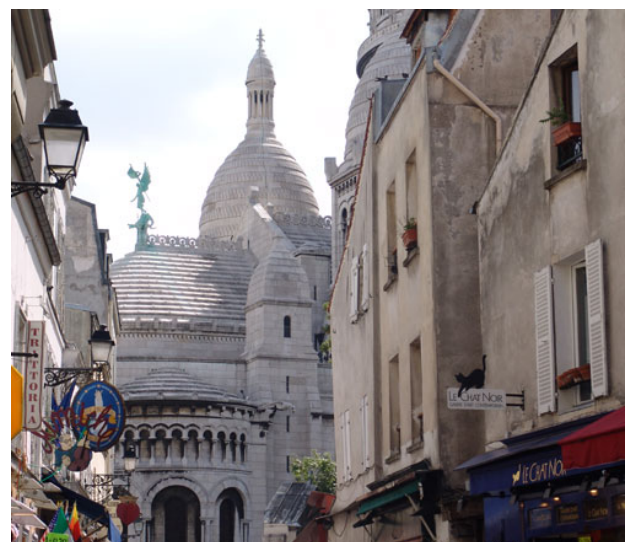
Paris: Gasse von Montmartre

Die Allgemeinen Reisebedingungen zu Begegnungs- und Informationsfahrten der JEPTT Sektion Darmstadt finden Sie im Internet unter www.jumelages.de/darmstadt