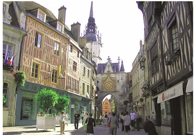
Auxerre: Centre Ville