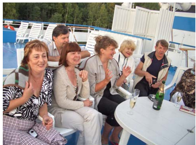
Unsere russischen Partner beim gemeinsamen Abend an Deck

Die "Leonid Krasin" nahm am 3. August Kurs auf Uglitsch, eine der ältesten Städte an der oberen Wolga. Dort besichtigten wir den Uglitscher Kreml mit der Dmitri-Blut-Kirche, die an die Ermordung des Sohnes Ivans des Schrecklichen erinnert. Am 4. und 5. August erreichten wir die altrussischen Städte auf dem "Goldenen Ring" Kostroma und Jaroslawl. Während der Stadtrundfahrten besuchten wir ehrwürdige Klöster und Kirchen mit prächtigen Ikonostasen. Unser Schiff erreichte am 6. August das Dorf Goritsy. Von dort fuhren wir mit einem Bus zur Stadt Kirillow, wo wir eines der berühmtesten Klöster Russlands, das Kirillo-Bjeloserskij-Kloster, besuchten. Es gleicht von außen einer Festung und beherbergt ein bedeutendes Ikonenmuseum.