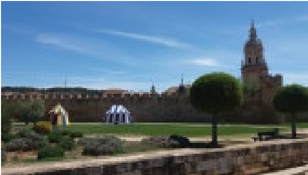
El Burgo de Osma

um auf der Plaza Mayor, dem Großen Platz (den gibt es in jedem Dorf, in jeder Stadt und ist oft sozusagen eine Art Biergarten), ein Bierchen zu trinken.