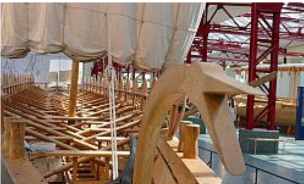
Ein originalgetreuer Schiffsnachbau

Heute unternahmen wir unter Teilnahme weiterer Darmstädter Jumeleure zunächst einen Ausflug in die Römerzeit, indem wir dem Museum für Antike Schifffahrt in Mainz einen Besuch abstatteten, das nicht weit vom Bahnhof „Römisches Theater“ in einer ehemaligen Lok-Halle untergebracht ist. Bei einer fachkundlichen Führung in englischer Sprache konnten wir die Vielfalt antiker Wasserfahrzeuge kennenlernen: