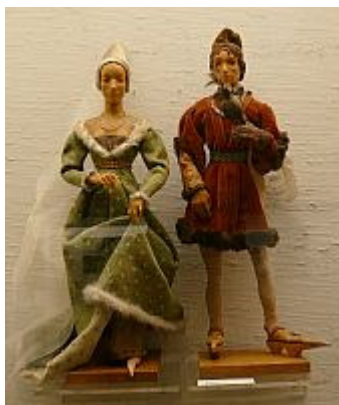
Schubmode zu passender Kleidung

Nach diesem Museumsbesuch waren die Gewitter endgültig abgezogen. Wir erreichten trockenen Fußes den Mainzer Hauptbahnhof und fuhren wieder zurück nach Darmstadt, wo wir zum Abschluss des Tages im „Braustübl“ Plätze reserviert hatten, um gemeinsam zu Abend zu essen.