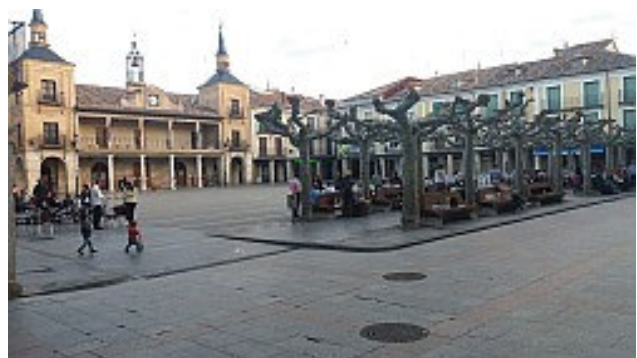
Plaza Mayor in El Burgo de Osma

Als ich hörte, der diesjährige Sprachkurs finde in einer Stadt mit nur 5.000 Einwohnern statt, war ich erst mal erschrocken. Aber: El Burgo de Osma ist ein „Bien de Interés Cultural“, eigentlich sogar Weltkulturerbe-würdig und eine wirklich schöne und interessante Stadt. Sie liegt etwa 100 km nördlich von Madrid in den Bergen in der Provinz Soria, die die kälteste in Spanien ist.