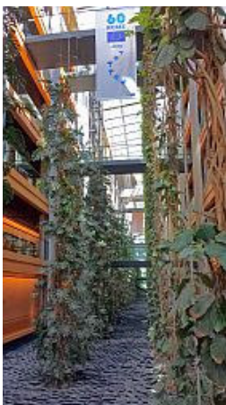
Innenhof der „Luise Weiss“

Los geht's Richtung Straßburg. Unterwegs berichtet Meinhard Dausin, der Organisator der Fahrt, dass das geplante Programm wegen des Besuchs des Generalsekretärs der Vereinten Nationen, António Guterres, im Europaparlament geändert werden musste.