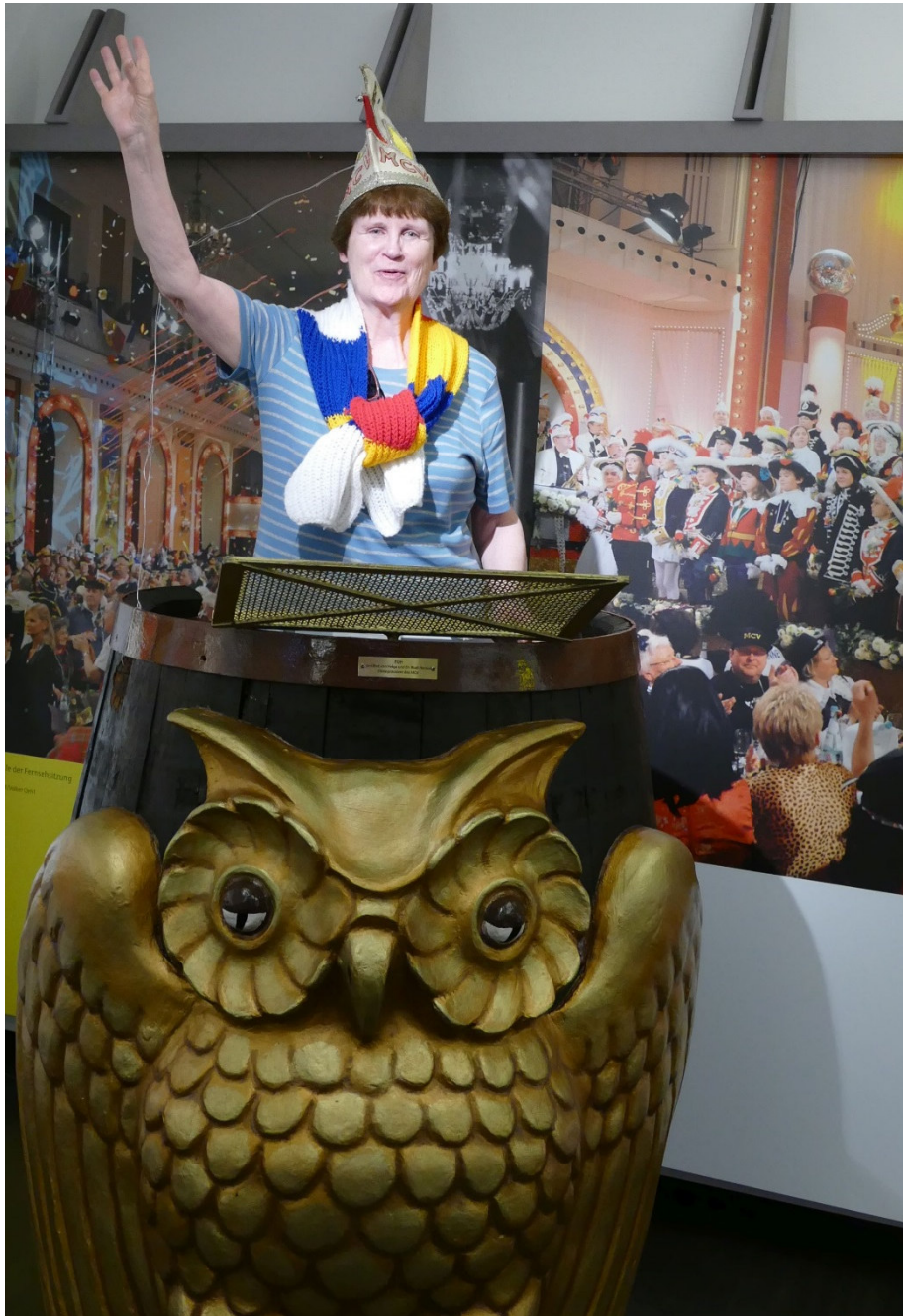
Irmis als Büttensprecherin beim Besuch des Mainzer Fastnachtsmuseums mit unseren englischen Partnern