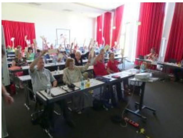
Die Delegierten beim Abstimmen

vor. Hierzu konnten die Delegierten Fragen stellen und Stellung nehmen.