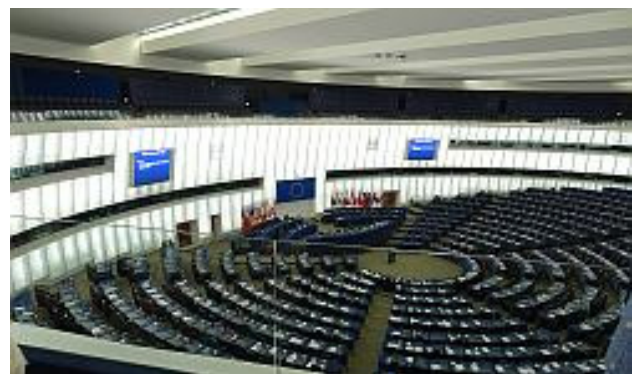
Plenarsaal des Europaparlaments

Wir erfahren, dass insgesamt 751 Europaabgeordnete aus (noch) 28 EU-Mitgliedsstaaten die Interessen der Unionsbürger vertreten. Deutschland stellt mit 96 Abgeordneten, darunter 35 Frauen, die größte Gruppe. Die Abgeordneten sitzen nicht in Landesgruppen zusammen, sondern schließen sich entsprechend ihrer politischen Ausrichtung einer der acht Fraktionen des Europaparlaments an.