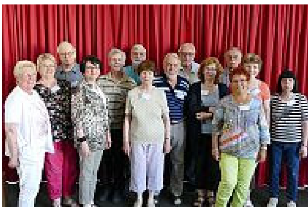
Mitglieder des frischgewählten Bundesvorstandes