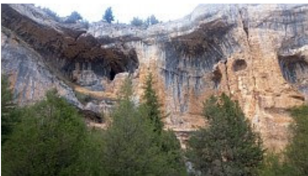
Cañon de Lobos

Das Stadtbild ist geprägt von mittelalterlichen Häusern, der Stadtmauer und einer riesigen Kathedrale, in der vermutlich problemlos alle Einwohner der Stadt Platz fänden. Das zeugt von einer bedeutenden Vergangenheit – In dieser Gegend verlief Jahrhunderte lang die Front zwischen Christen und den muslimischen Mauren. In der Nähe befinden sich die Ruinen eines riesigen maurischen Forts, das wir