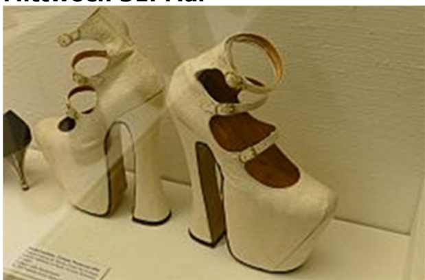
Im Ledermuseum: Schubmode von anno dazumal

Wer sich für 1000 verschiedene Arten interessiert, wie man mit entsprechendem Schuhwerk seine Füße quälen kann, dem ist ein Besuch im Offenbacher Ledermuseum zu empfehlen. Nach einem kleinen Spaziergang zu den Nilgänsen und Schwänen am Mainufer und dem Mittagessen im schattigen Garten