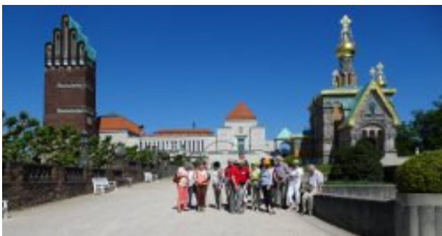
An der Mathildenhöhe

Satzungsgemäß findet alle drei Jahre eine Delegiertenversammlung der Jumelages Européens PTT e.V. (JEPTT) statt. 2017 erfolgte die Durchführung in Darmstadt. Die Teilnehmer tagten dort vom 26. bis 27. Mai 2017 im Commundo-Tagungshotel.