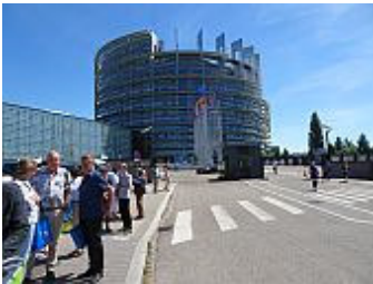
Vor dem Europäischen Parlament

Am 17. Mai 2017, um 8 Uhr, sind alle Teilnehmerinnen und Teilnehmer der Tagesfahrt zum Informationsbesuch beim Europaparlament an Bord des Reisebusses: