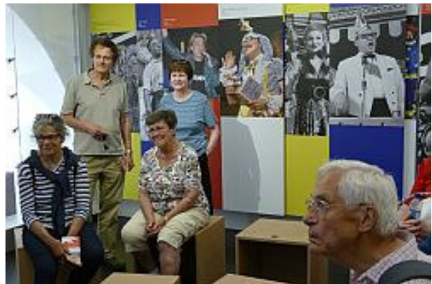
Jumeleure lauschen historischen Büttreden

Frisch gestärkt und bei wieder blauem Himmel schlenderten wir dann durch die Augustinergasse, sahen uns das Innere der barocken Augustinerkirche an und standen gegenüber vom Theater auf dem 50. Grad nördlicher Breite. Weiter ging es am Gardetrommler vorbei zum Fastnachtsbrunnen. Hier verfärbte sich der Himmel abermals sehr dunkel. Wir sputeten uns, und als die ersten Regentropfen fielen, waren wir froh, das Fastnachtsmuseum erreicht zu haben, das einen Überblick über das seit 1837 in organisierter Form gefeierte Volksfest bietet.