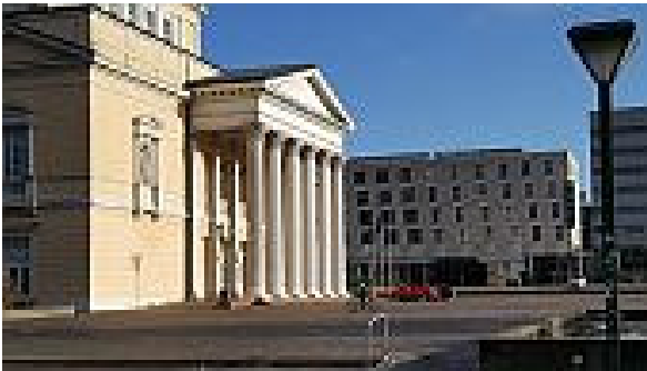
Neujahrstreffen nahe dem ehemaligen Theater

Wie jedes Jahr im Januar lud der Vorstand zum Neujahrstreffen ein. Nachdem das Hotel Maritim Rhein-Main dieses Jahr nicht mehr zur Verfügung stand, war die Wahl auf das Welcome-Hotel in der Darmstädter Innenstadt gefallen.