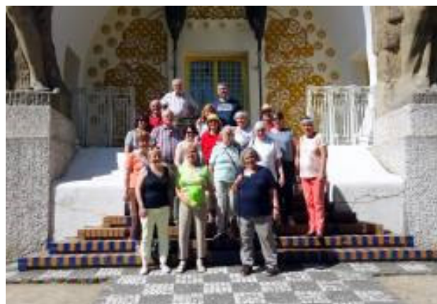
Nach getaner Arbeit

Anträge angenommen. Nach einer erholsamen Pause rief die Versammlungsleiterin den Tagesordnungspunkt „Wahlen“ auf.